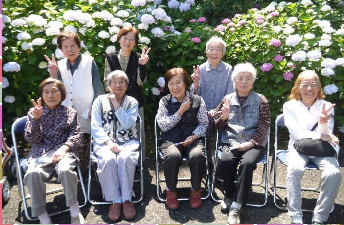
季節行事 紫陽花見物